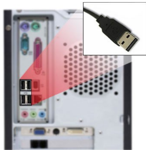
Vista conector USB Trasero en PC