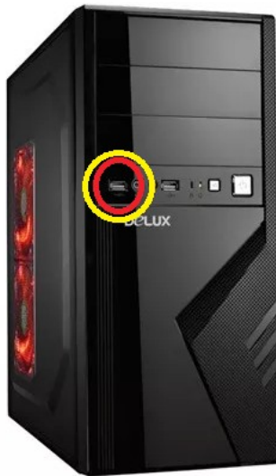
Vista conector USB Frontal en PC