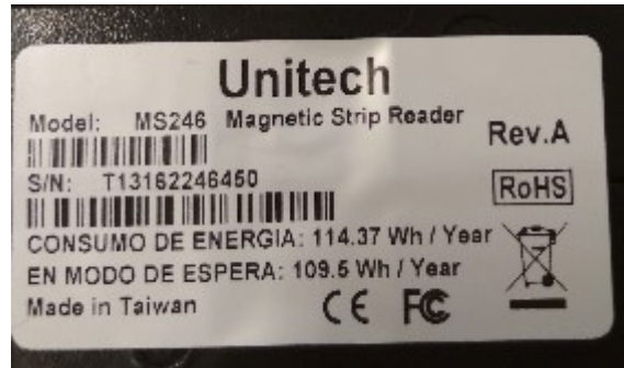
Lector Unitech MS246 Dorsó