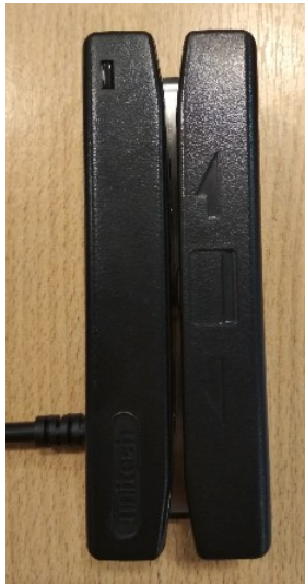
Lector Unitech MS246 Frente

Unión Personal utiliza y recomienda lectores de Banda Magnética Unitech modelo MS245/246; dichos lectores se encuentran debidamente testeados y verificados en todas las instancias del SVE. No está garantizado la correcta lectura de credenciales con otros fabricantes o diferentes modelos de la marca Unitech.